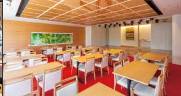
2F EDOCCO (Edo Culture Complex) 文化交流館