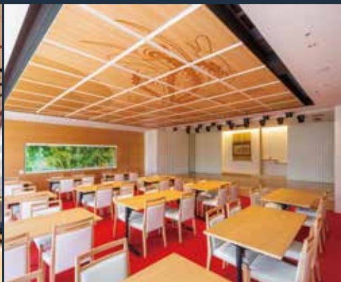
2F EDOCCO (Edo Culture Complex) 文化交流館